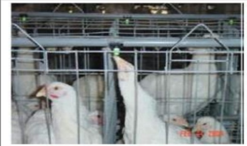
Nipple pipeline (in enclosures)