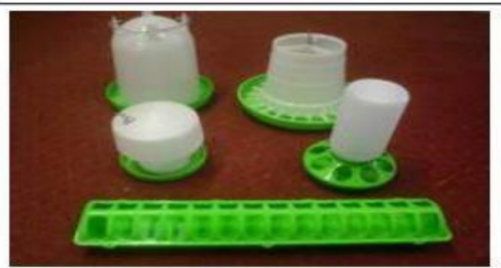
Manual feeder pans