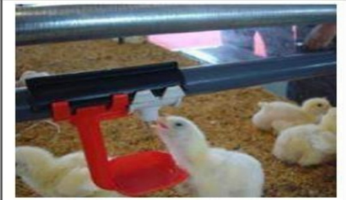
Nipple drinker (in deep litter)